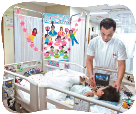
患者さんに優しく接する男性看護師

私たち男性看護師一人一人がこの職業に高い誇りを持ち、時には壁にぶつかりながらも患者さんに安心していただける看護が行えるよう、日々前向きに頑張っています！