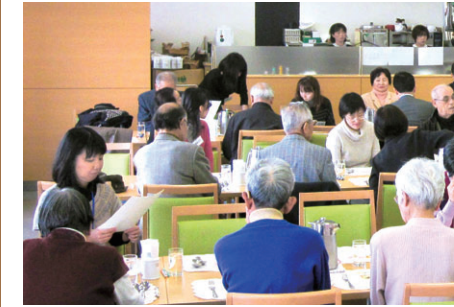
腎友会の会員が楽しみにしている食事会

腎臓病の食事療法は、塩分とたんぱく質の制限が不可欠なため、患者さんにはあまり評判が良くありません。そこで毎回、栄養管理室の管理栄養士の指導のもと、阪大病院のスタッフが工夫を凝らして作