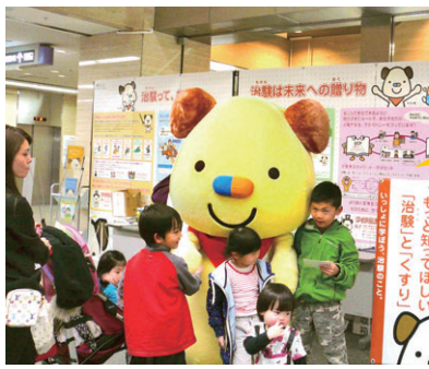
治療のゆるキャラちけん君を、診察待ちの子どもたちが取り囲んだ

新しく開発された薬の承認を厚生労働省から受けるため、有効性や安全性などを患者さんに協力していただくべく、治療について理解を深めてもらうべく、阪大病院臨床試験部が3月27、28日、エントランスホールで治療啓発キャンペーンを