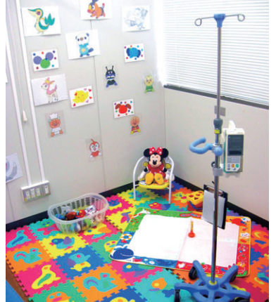
乳幼児の患者さんのため、家にいるかのように工夫し準備した外来化学療法室の一角

化学療法部の外来化学療法室では、がん治療を受ける患者さんに外来で安全、快適に化学療法（抗がん剤治療）を受けていただいています。これまで成人が対象でしたが、一部の小児患者さんを受け入れるようになりました。また、リウマチなどの自己免疫性疾患の患者さんの利用も増えています。