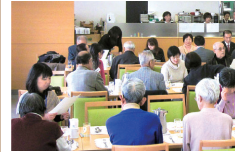
腎友会の会員が楽しみにしている食事会

腎臓病の食事療法は、塩分とたんぱく質の制限が不可欠なため、患者さんにはあまり評判が良くありません。そこで毎回、栄養管理室の管理栄養士の指導のもと、阪大病院のスタッフが工夫を凝らして作