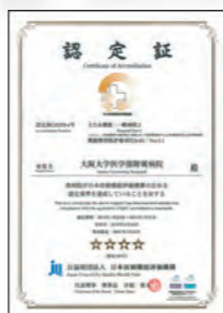
●病院機能評価認定証 2016年1月に(公財)日本医療機能評価機構から最新基準(3rdG:Ver.1.1)に認定されました。