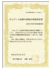
●がんゲノム医療中核拠点病院指定書 2018年2月に厚生労働省から指定を受けました。