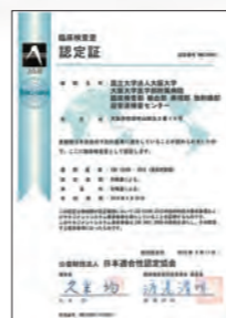
●ISO15189認定証 2015年9月に(公財)日本適合性認定協会から認定承認を受けました。