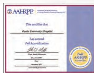
●国際認証AAHRPP取得 2022年12月に日本の病院で初めて AAHRPP(The Association for the Accreditation of Human Research Protection Programs, Inc.®)から 認証を得ました。