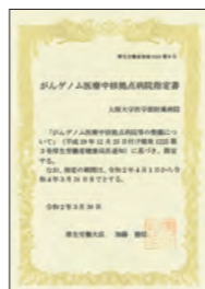
●がんゲノム医療中核拠点病院指定書 2023年3月に厚生労働省から 再指定を受けました。