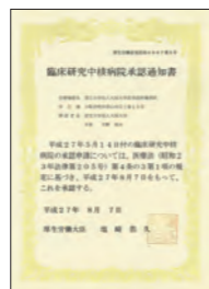
●臨床研究中核病院承認通知書 2015年8月に厚生労働省から 再指定を受けました。