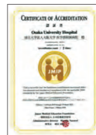
●外国人患者受入れ医療機関認定制度(JMIP)認証書 2022年3月に(一財)日本医療教育財団から 再認されました。