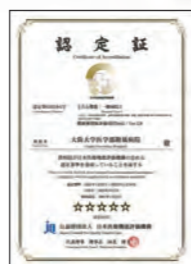
●病院機能評価認定証 2022年1月に (公財)日本医療機能評価機構から 最新基準(3rdG:Ver.2.0)に 認定されました。