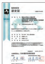
●ISO15189認定証 2015年9月に (公財)日本適合性認定協会から 認定承認されました。