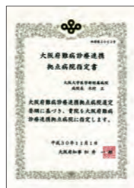
●大阪府難病診療連携拠点病院指定書 2018年11月に 大阪府から指定を受けました。