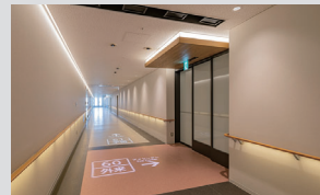
【6階 アイセンター廊下】

NICU (新生児特定集中治療室)は9床→12床に増床、うち1床を重症対応の個室とすることで機能を強化。また、壁及び天井には、赤ちゃんと直接風が当たらないよう輻射空調パネルを採用。