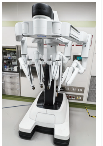
手術支援ロボット「Da Vinci(ダヴィンチ)」

スタッフは管理運営を担う医師が5人、看護師84人が所属。30名以上の麻酔科医師が全身麻酔に対応。医療機器のプロである臨床工学技士は8人、診療放射線技師3人、専従の薬剤師が1人います。適切な分業により外科医師や看護師が患者さんへの対応に専念できる態勢を築いているのが本院の特徴です。