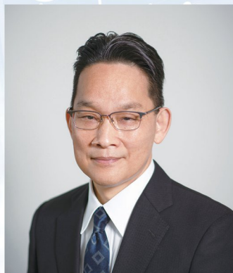
大阪大学医学部附属病院 病院長 教授